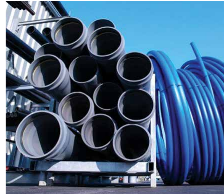
Các ngành giày da, dệt may, nhựa và đồ gỗ có nhiều cơ hội xuất khẩu trong năm 2014