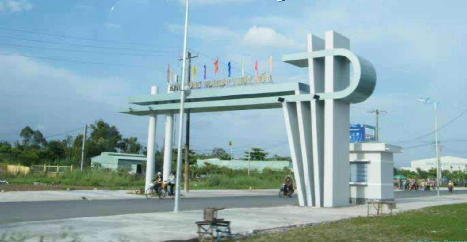
Cổng vào Khu công nghiệp quận Thốt Nốt. Quận Thốt Nốt cũng được xem là quận có nhiều tiềm năng phát triển công nghiệp và du lịch sinh thái