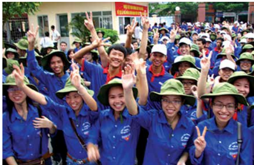
Hừng hực tinh thần tình nguyện của thanh niên trong chiến dịch Mùa Hè Xanh

T ình nguyện đã trở thành một phẩm chất đặc trưng, nổi bật của tuổi trẻ nói chung. Tình nguyện là phẩm chất, giá trị tốt đẹp được thể hiện và chia sẻ trên cả thế giới. Phong trào tình nguyện đã và đang phát triển mạnh mẽ ở nhiều quốc gia. Tuy nhiên, với điều kiện lịch sử, địa lý và xã hội riêng có, phong trào tình nguyện ở Việt Nam có những đặc trưng khác biệt.