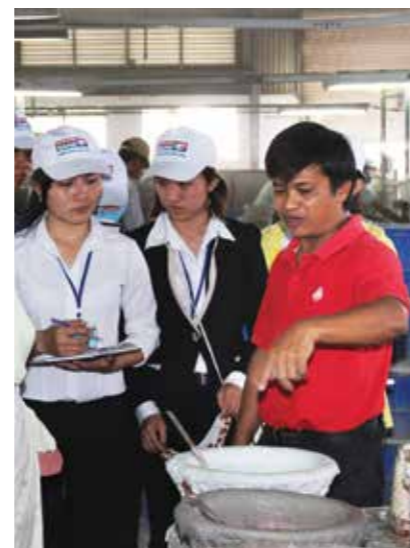
Tham quan nhà máy sản xuất gạch bông Đống Tâm