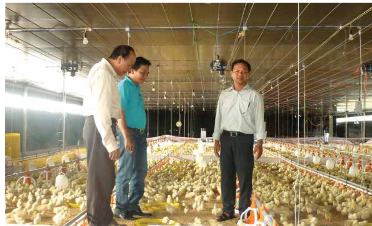
Kienlongbank - Chi nhánh Hà Nội tăng cường tiếp cận các hộ làm kinh tế trang trại vùng ven thủ đô