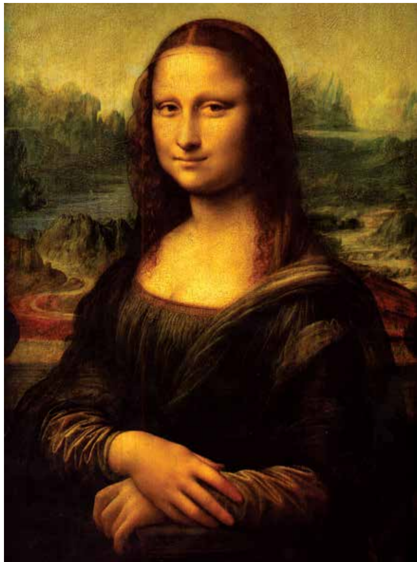
Bức tranh nàng Mona Lisa của Leonardo da Vinci đã tạo cảm hứng cho rất nhiều người. Nụ cười Mona Lisa đại diện cho một cái gì đó rất bí ẩn...

Truyền thuyết kể rằng: Thượng đế tạo nên phụ nữ từ chiếc xương sườn của người đàn ông. Vậy Thượng đế đã làm như thế nào?