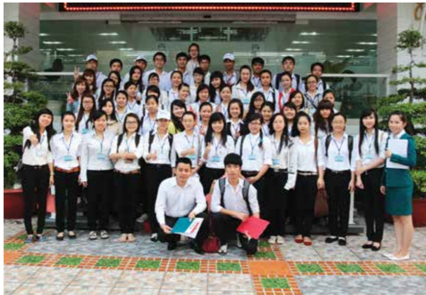
Các sinh viên tham gia chương trình thực tập tại Kienlongbank

Chương trình thực tập ở Kienlongbank sẽ diễn ra trong 03 tháng. Các sinh viên