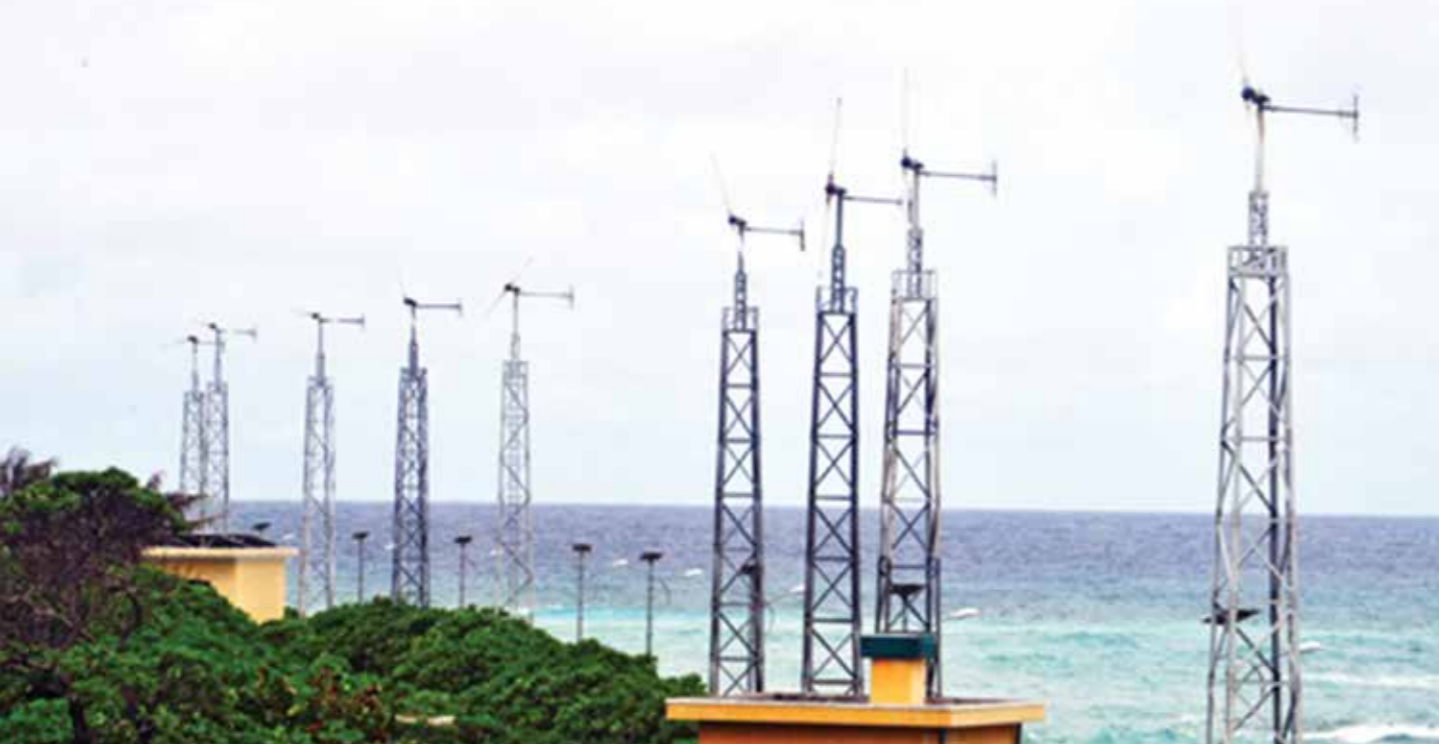
Những cây quạt gió khổng lồ được gắn với những tua-bin điện được lắp trên đảo Trường Sa

N gày trước, khi nhắc đến Trường Sa, người ta nhớ ngay tới cái nắng, cái gió khắc nghiệt ở vùng biển đảo xa xôi của Tổ quốc. Thì ngày hôm nay đây, cũng cái nắng, cái gió đó nhưng nó đã được chuyển hóa thành năng lượng điện sạch, mang lại cho Trường Sa một diện mạo mới đẹp hơn, lung linh hơn, rút ngắn khoảng cách Trường Sa với đất liền đúng như câu hát: Trường Sa không xa!