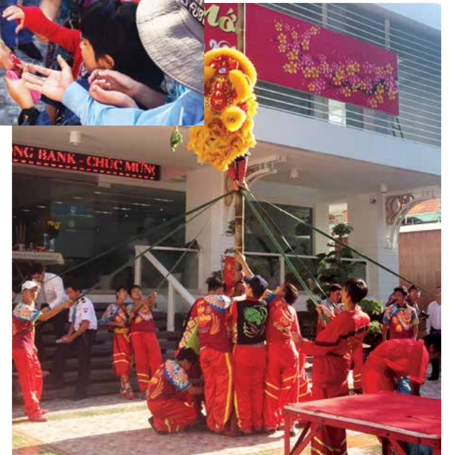
Múa Lân - Sư - Rồng mừng khai trương năm mới

NGÀY MÙNG 6 TẾT NĂM NAY (05/02/2014) ĐƯỢC RẤT NHIỀU NGƯỜI CHO LÀ NGÀY ĐẸP VÀ CHỌN LÀM NGÀY KHAI TRƯƠNG HOẠT ĐỘNG CHO NĂM MỚI.