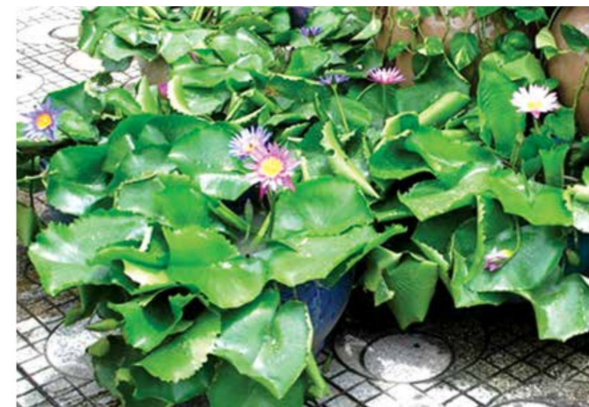
Hoa súng thường được trồng ở các khu vườn công cộng, trong ao. Trong ảnh là loại hoa súng được trồng trong chậu, rất được nhiều người ưa thích để làm chậu cảnh tại nhà.