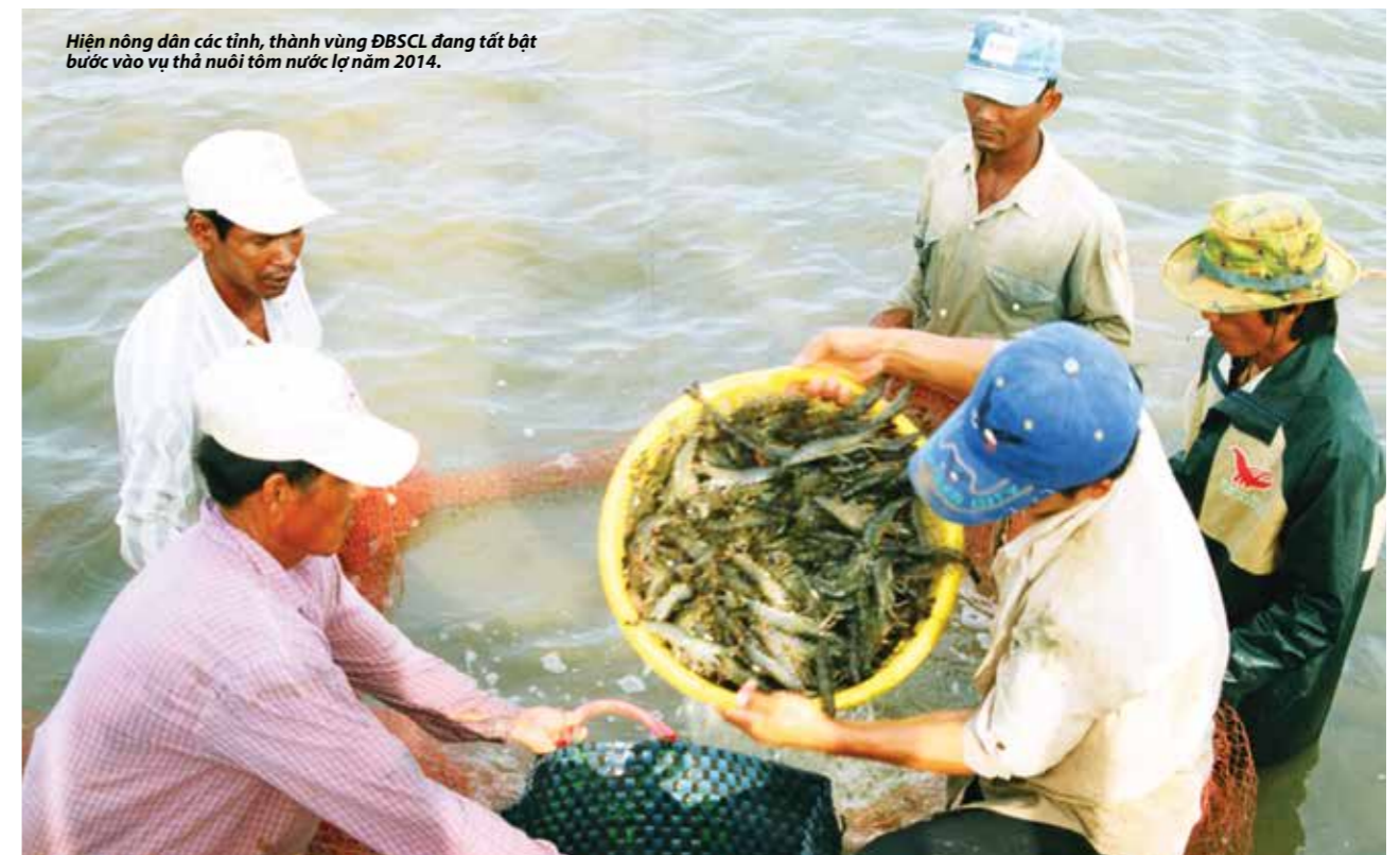
Hiện nông dân các tỉnh, thành vùng ĐBSCL đang tất bật bước vào vụ thả nuôi tôm nước lợ năm 2014.

Ngoài sự vào cuộc tích cực của đơn vị chủ công, các địa phương, Bộ NN&PTNT cũng mong Chính phủ tiếp tục chỉ đạo các bộ, ngành có liên quan tiếp tục bố trí nguồn vốn để đầu tư xây dựng cơ sở hạ tầng vùng nuôi tôm, xây dựng hệ thống thủy lợi phục vụ thủy sản, đầu tư trong lĩnh vực giống thủy sản, quan trắc cảnh báo môi trường... để vụ tôm 2014 tiếp tục thắng lợi. Trong năm 2014, diện tích tôm sú cả nước phấn đấu đạt 590.000ha, sản lượng 270.000 tấn; tôm chân trắng 80.000 ha với sản lượng 290.000 tấn.