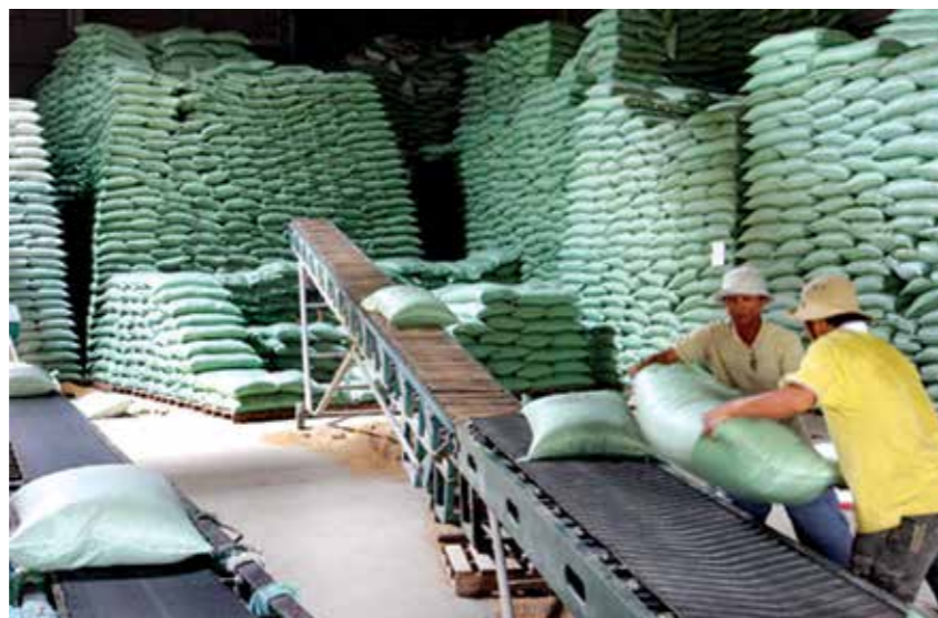
Các hoạt động sản xuất, kinh tế khá phổ biến ở Thốt Nốt: xay xát lúa gạo, trồng rau màu và chăn nuôi...

Tổng sản phẩm trên địa bàn quận Thốt Nốt (GDP) vào khoảng 6.860 tỷ đồng. Thế mạnh của quận Thốt Nốt là lĩnh vực trồng trọt (chủ yếu là cây lúa), chăn nuôi, thủy sản và thương mại đầu mối, công nghiệp nhẹ. Các dịch vụ vận tải, dịch vụ