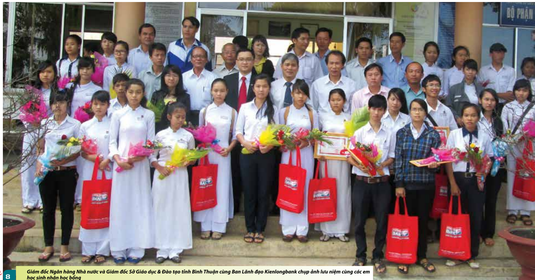
Giám đốc Ngân hàng Nhà nước và Giám đốc Sở Giáo dục & Đào tạo tỉnh Bình Thuận cùng Ban Lãnh đạo Kienlongbank chụp ảnh lưu niệm cùng các em học sinh nhận học bổng

Vui mừng khi nhận được học bổng, một em học sinh bày tỏ: Mỗi người trong