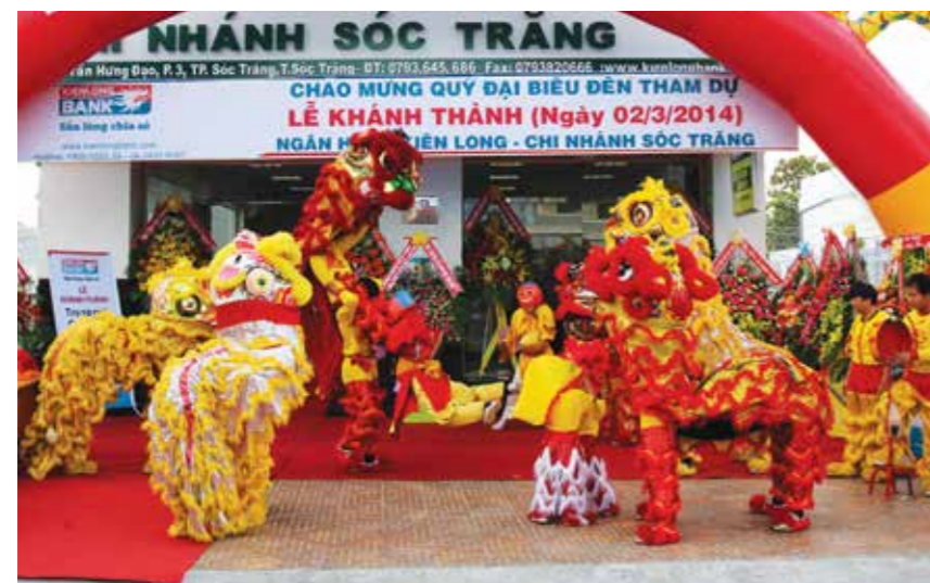
Rộn ràng múa lân mừng khai trương trụ sở mới