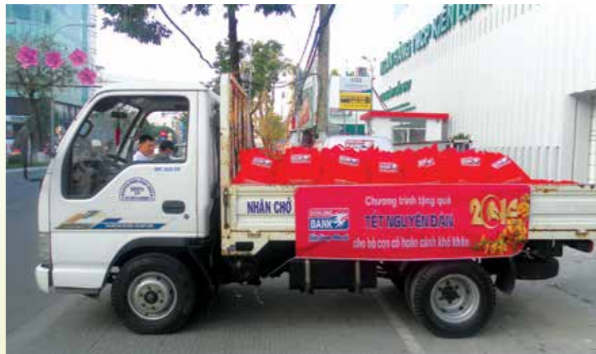
Rộn ràng những chuyến xe chở quà và chương trình tặng quà Tết của Kienlongbank đến bà con có hoàn cảnh khó khăn...