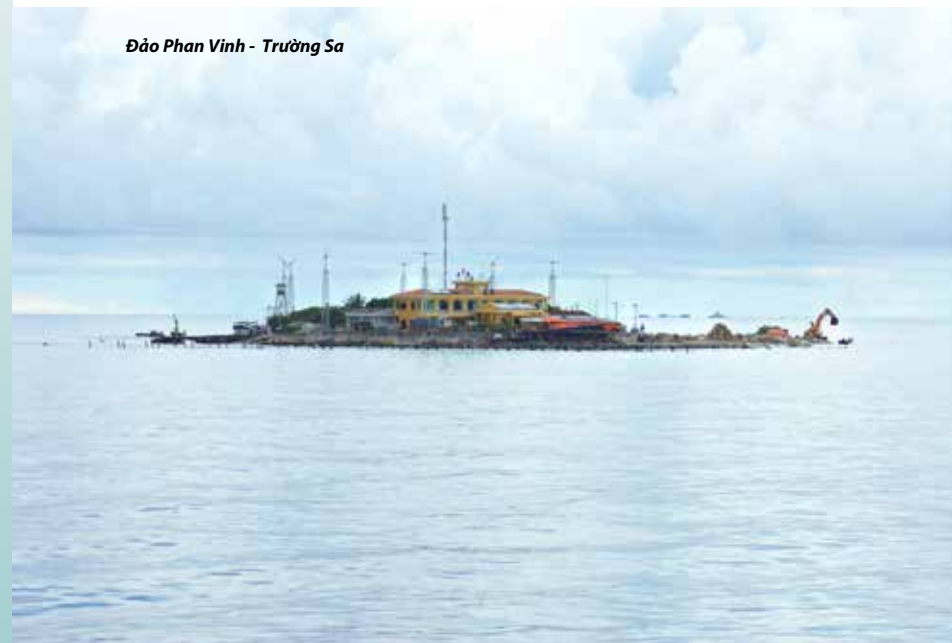
Đảo Phan Vinh - Trường Sa