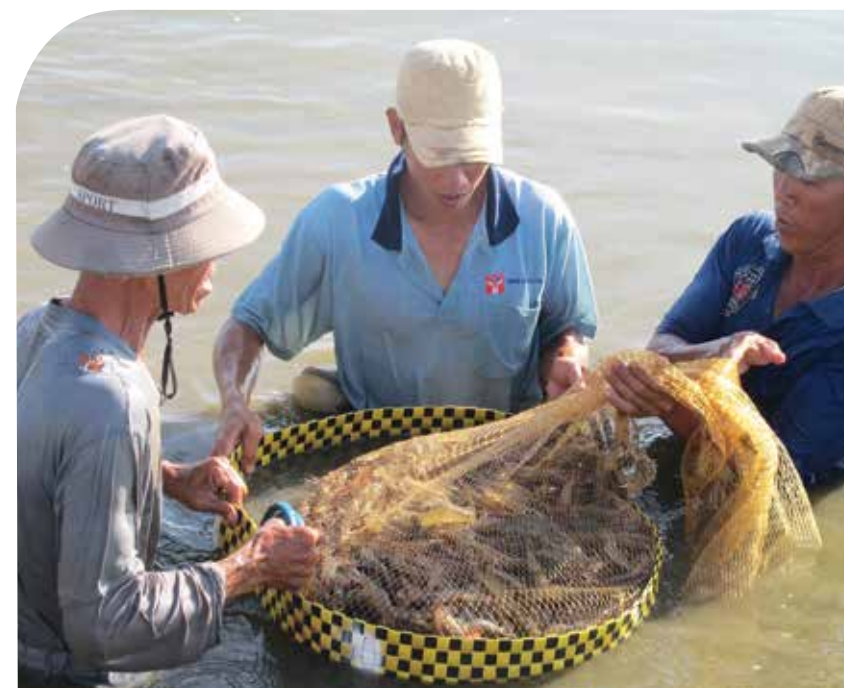
5 tháng đầu năm, kim ngạch xuất khẩu tôm tăng 70,4%, còn cá tra giảm 3,8% so với cùng kỳ năm ngoái nên kim ngạch xuất khẩu tôm đã hơn gấp đôi cá tra: 1,47 tỷ và 682 triệu USD.

T ôm thẻ chân trắng là loại tôm nuôi trong vùng nước lợ, được nông dân ĐBSCL đánh giá “có giá trị kinh tế cao, mức đầu tư thấp, mùa vụ nuôi ngắn, cho năng suất cao, dễ tiêu thụ, kích cỡ tôm phù hợp với nhu cầu tiêu thụ của thế giới. Với giá bán 120.000 đồng/kg (loại 60-70 con/kg), tôm thẻ chân trắng cho hiệu quả kinh tế cao hơn so với các loài thủy sản khác như cá tra có mức giá 21.000 đồng/kg. Năng suất bình quân mỗi hecta mặt nước đạt từ 5 tấn trở lên.