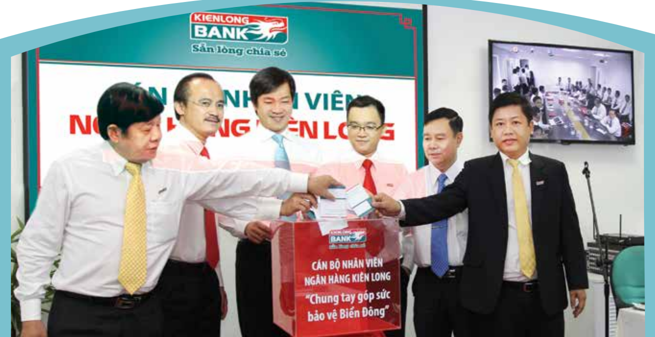
Các thành viên Hội đồng quản trị, Ban Kiểm soát, Ban Tổng Giám đốc, tham gia đóng góp chương trình “Chung tay góp sức bảo vệ Biển Đông” tại Kienlongbank sáng ngày 21/7/2014. Toàn thể cán bộ - nhân viên Kienlongbank đã tham gia đóng góp với tổng số tiền trên 530 triệu đồng.