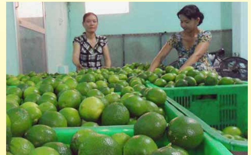
Chanh không hạt đang được lựa chọn để đóng thùng xuất khẩu.

Để phát triển cây chanh, ông lại phải lặn lội đi khắp nơi từ Bình Dương, Bến Tre, Cần Thơ, Tiền Giang... tìm hiểu, học hỏi kinh nghiệm từ các mô hình trồng chanh. Sau đó ông mang những kiến thức đó áp dụng cho vườn của mình và dần dần các vườn chanh nhà ông phát triển tốt, tỷ lệ đậu trái cao... May mắn chỉ mỉm cười với gia đình ông khi vào