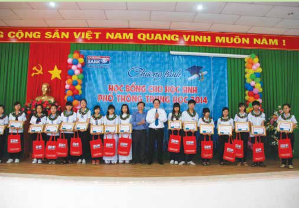
Các em học sinh ở tỉnh Bà Rịa - Vũng Tàu vui mừng đón nhận học bổng của Kienlongbank