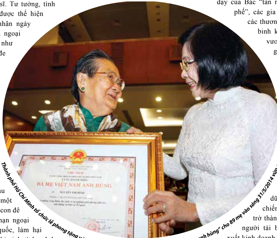
Thành phố Hồ Chí Minh tổ chức lễ phong tặng và truy tặng danh hiệu Nhà nước “Bà mẹ Việt Nam anh hùng” cho 89 mẹ vào sáng 31/5/2014 vừa qua.

các cháu tổ chức những Đội Trần Quốc Toàn để đi đánh giặc và lập nhiều chiến công nhưng mà cốt để tham gia kháng chiến, bằng cách giúp đỡ đồng bào. Từ 5 đến 10 cháu tổ chức thành một đội, giúp nhau học hành. Khi học rảnh, mỗi tuần mấy lần cả đội đem nhau đi giúp đồng bào. Trước thì giúp các nhà thương binh, lần lượt giúp nhà ít người.