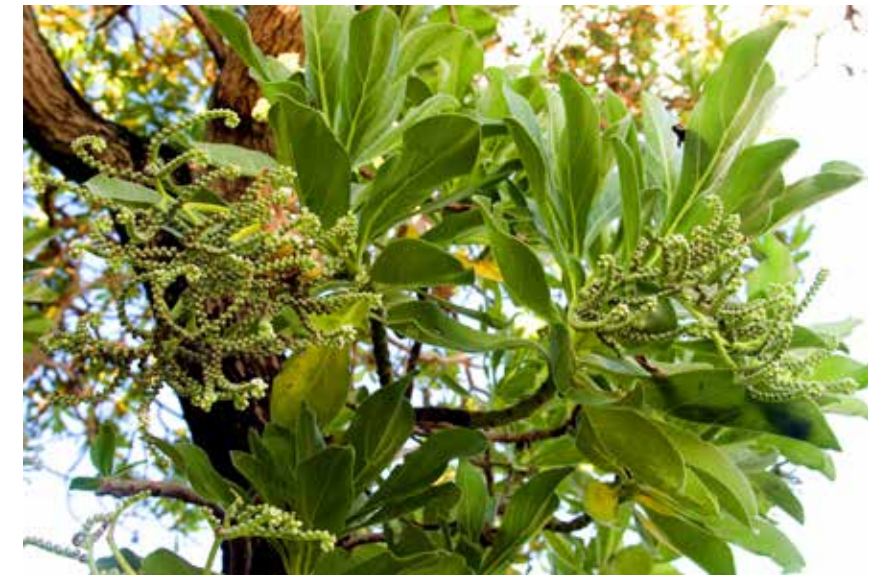
Hoa phong ba ở Trường Sa

Hơn một tháng nay tôi càng bất ngờ hơn khi sản lượng gạch bán ra tăng, dù tình