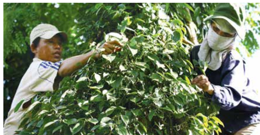
Tại khu vực Tây Nguyên, giá hồ tiêu dao động ở mức 180.000 - 185.000 đồng/kg. Đây là mức giá cao nhất từ trước đến nay của ngành hồ tiêu Việt Nam, tạo nguồn lãi rất lớn cho nông dân.