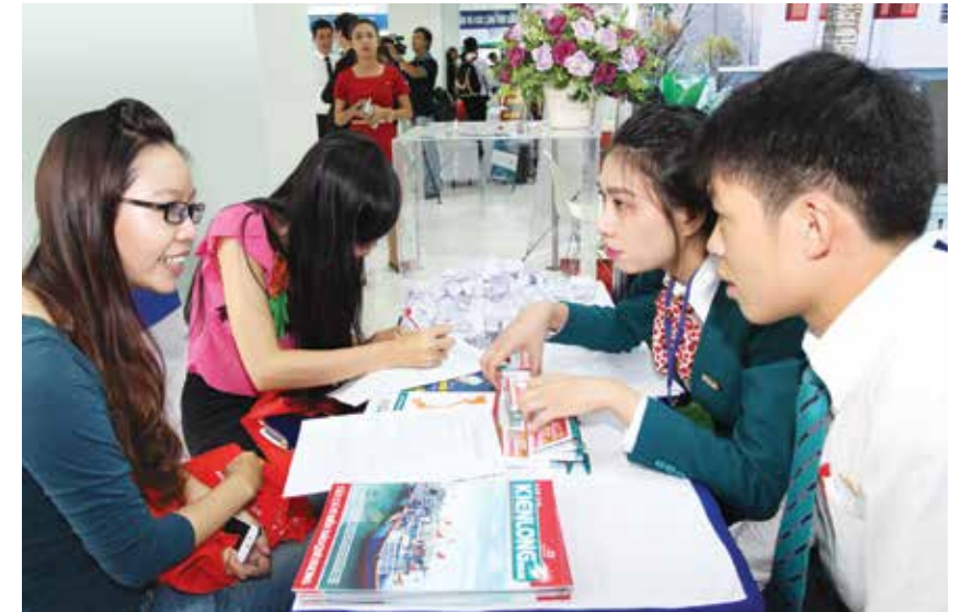
Nhân viên Kienlongbank đang tư vấn cho khách hàng

S áng ngày 11/7, Triển lãm Bất động sản 2014: “Giao dịch nhà - đất giá trên dưới 1 tỷ đồng” đã chính thức khai mạc tại 81 Trần Quốc Thảo, phường 7, quận 3, TP.HCM. Ngân hàng TMCP Kiên Long (Kienlongbank) tham dự triển lãm nhằm tiếp cận và hỗ trợ khách hàng các khoản vay cần thiết để mua nhà.