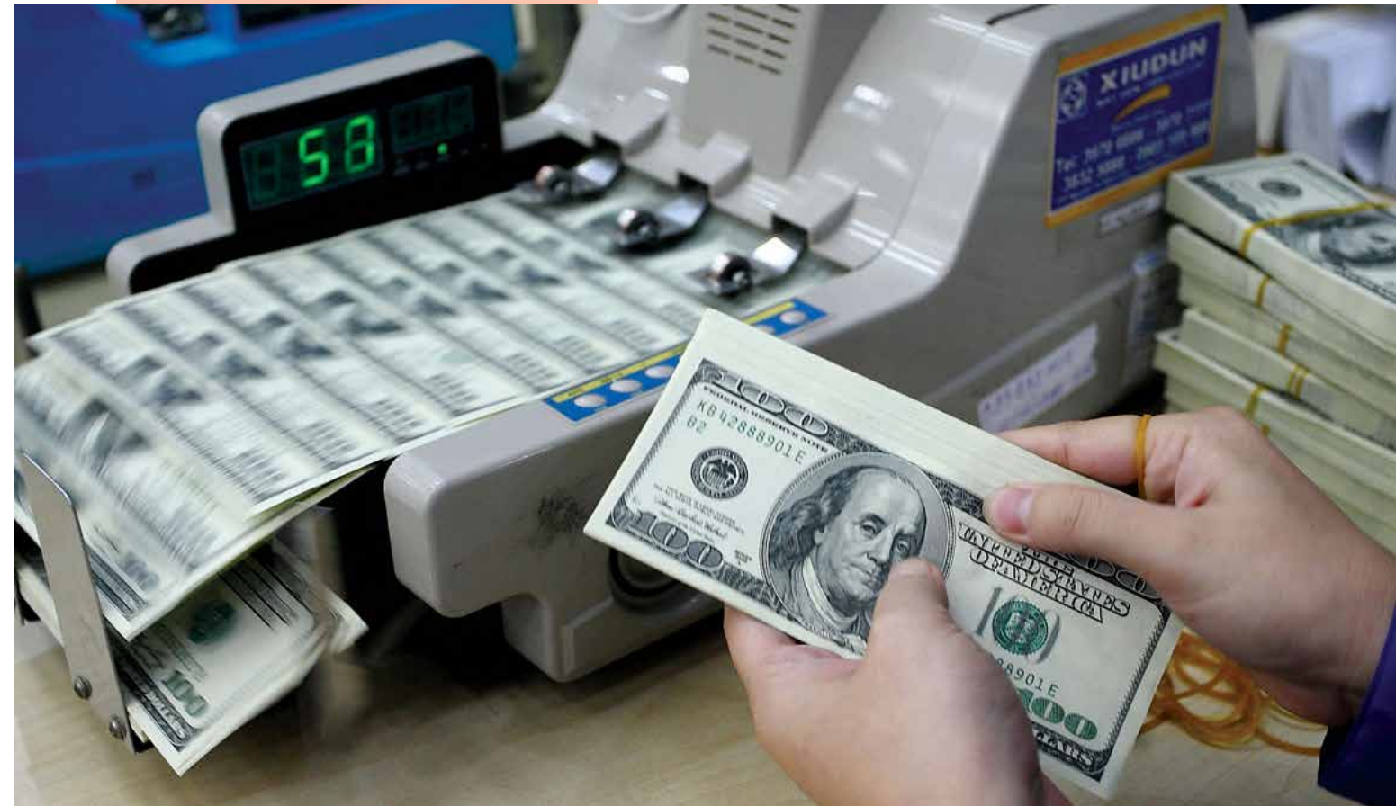
Dự trữ ngoại hối của Việt Nam tăng liên tục trong 3 năm qua và đang đạt mức kỷ lục với 35 tỷ USD.