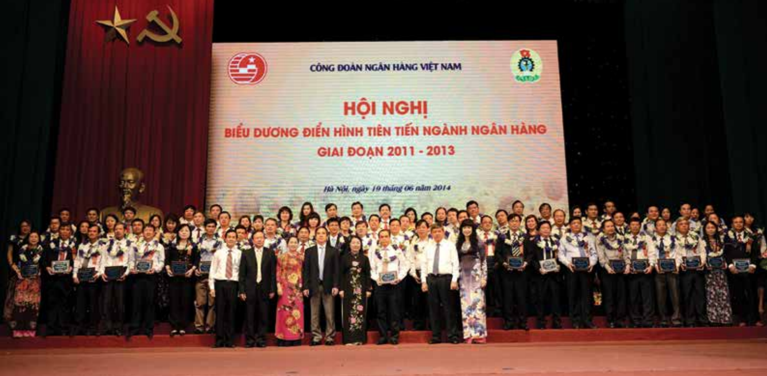
Thống đốc NHNN Nguyễn Văn Bình chụp ảnh lưu niệm cùng 85 cá nhân tiêu biểu tại Hội nghị Biểu dương điển hình tiên tiến ngành ngân hàng.