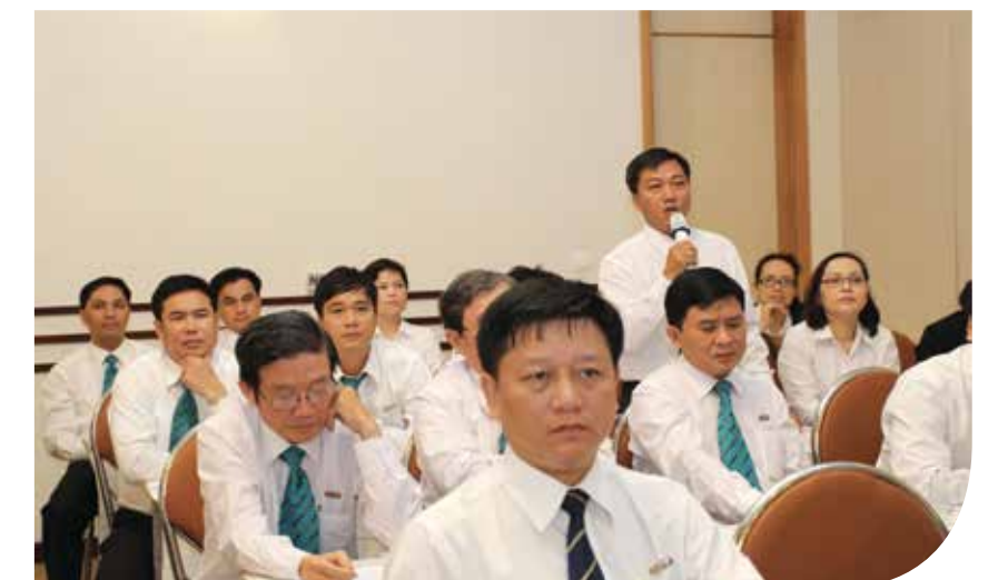
Thành viên dự Hội nghị đóng góp ý kiến