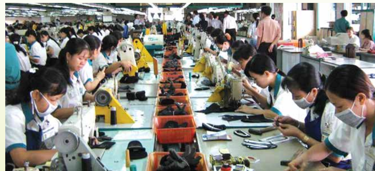
Hàng loạt các hiệp định thương mại quốc tế có khả năng sẽ được ký kết trong thời gian tới sẽ mở ra những cơ hội chưa từng có cho ngành da giày.

Theo Bộ Công Thương, 6 tháng đầu năm 2014, sản phẩm da giày xuất khẩu ước đạt 4,8 tỷ USD, tăng gần 22% so với cùng kỳ năm trước. Dự báo, số lượng đơn hàng từ xuất khẩu sẽ tăng từ nay đến cuối năm và kim ngạch xuất khẩu da giày cả năm sẽ vượt mốc 11 tỷ USD.