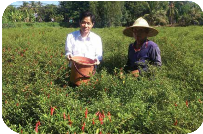
Cán bộ Kienlongbank sát cánh cùng bà con nông dân

Trở thành vùng chuyên canh, "thương hiệu" ớt Hồng Ngự được nhiều người biết đến. Khi vào thời điểm thu hoạch, bà con không cần chờ ớt đến các chợ để bán, thay vào đó các cơ sở thu mua đã tranh nhau đến tận ruộng để gom hàng. Không chỉ thu mua phù hợp với giá thị trường, các chủ cơ sở này còn tìm được đầu ra ổn định ở nước ngoài, nên các sản phẩm từ ớt của Hồng Ngự đã có mặt trên bàn ăn của nhiều nước. Hiện nay nhu cầu xuất khẩu ớt sang các nước Châu Á như Ấn Độ, Hàn Quốc, Singapore, Thái Lan, Trung Quốc,... đang tăng mạnh nên giá ớt sẽ có xu hướng ổn