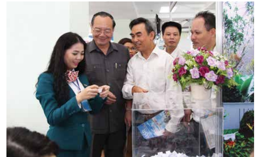
Đồng đạo khách hàng tham quan gian hàng của Kienlongbank và tham gia bốc thăm may mắn.

Tham gia triển lãm có hơn 60 gian hàng của trên 20 doanh nghiệp, dành giới thiệu khoảng 40 sản phẩm gồm: nhà ở xã hội; nhà đất dự án; căn hộ; nhà đất riêng lẻ có giá trên dưới 1 tỷ đồng tại khu vực TP.HCM và các tỉnh lân cận như Bình Dương, Long An, ... Đây là những sản phẩm có hồ sơ pháp lý rõ ràng, đầy đủ; chủ đầu tư uy tín; sản phẩm có thương hiệu trên thị trường được chọn lọc từ các công ty bất động sản uy tín.