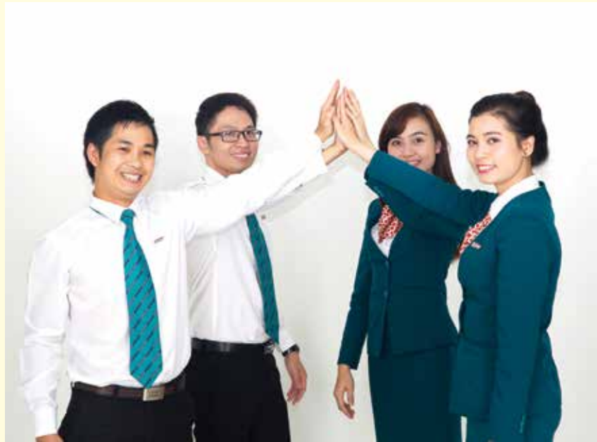
Nhân viên Kienlongbank đoàn kết, sáng tạo, hỗ trợ nhau trong công việc

Đông đảo người lao động tại Kienlongbank đã hào hứng tham gia cuộc thi này. Cuộc thi diễn ra ở 2 vòng: vòng 1 ở cấp đơn vị và vòng 2 tổ chức thi trực tuyến tập